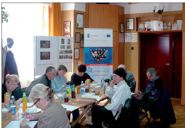
Spotkanie informacyjne na temat Ekonomii Społecznej w gminie Kamionka Wielka