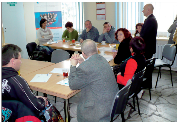
Promocja idei Ekonomii Społecznej w siedzibie Inkubatora Ekonomii Społecznej w Nowym Sączu