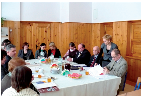
Budowanie Partnerstwa Lokalnego na rzecz rozwoju Ekonomii Społecznej w gminie Łososina Dolna