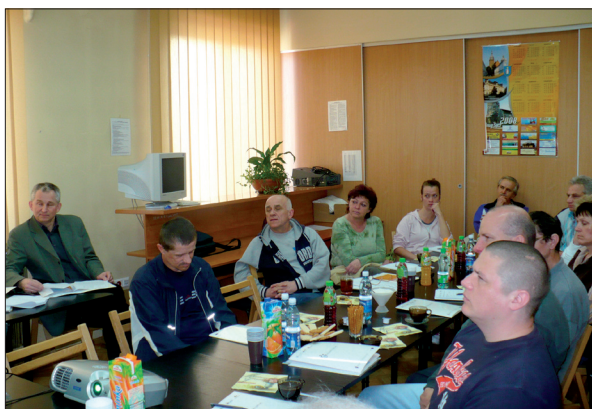
Spotkanie promujące zakładanie podmiotów Ekonomii Społecznej – Nowy Sącz