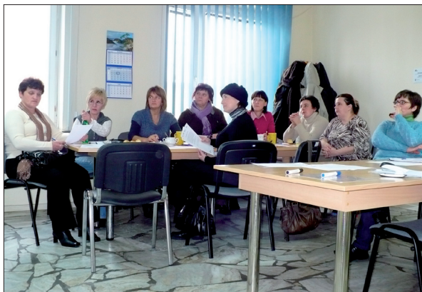
Spotkanie założycielskie Stowarzyszenia „Aktywne Wsparcie” – Nowy Sącz