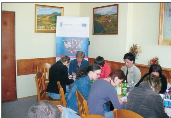
Spotkanie informacyjno-promocyjne w Urzędzie Gminy Nawojowa