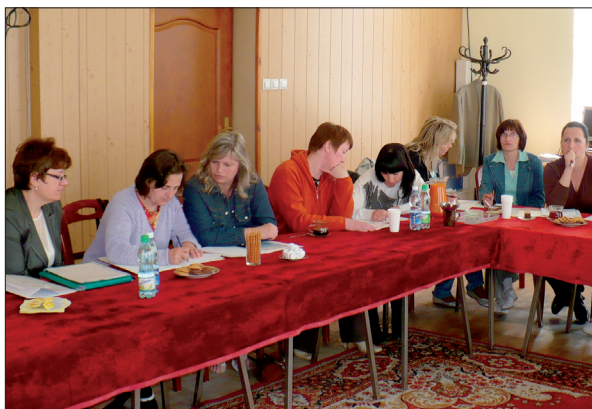
Promowanie tworzenia podmiotów Ekonomii Społecznej w gminie Chetmieć