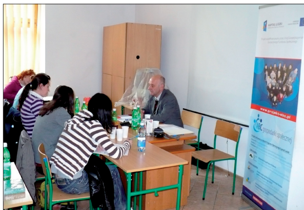
Zajęcia na temat ekonomii społecznej dla uczniów Policealnej Szkoły Pracowników Służb Medycznych i Społecznych w Nowym Sączu