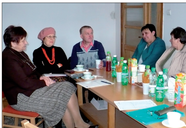
Spotkanie informacyjne na temat usług Inkubatora Ekonomii Społecznej dla mieszkańców gminy Łącko