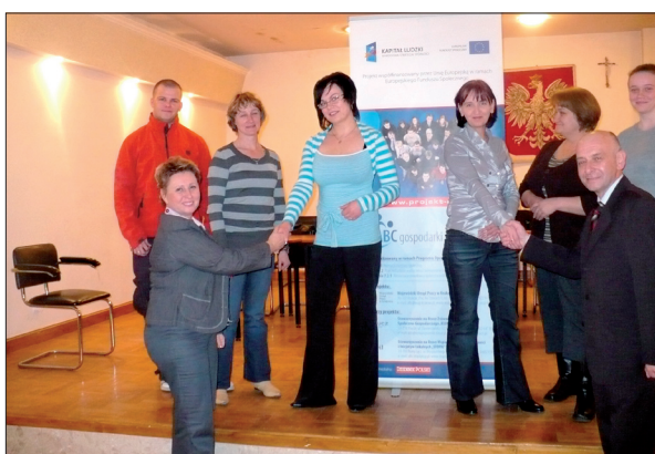
Gratulacje kadry projektu z okazji rejestracji Spółdzielni Socjalnej „Zdrojowianka” w Piwnicznej-Zdroju